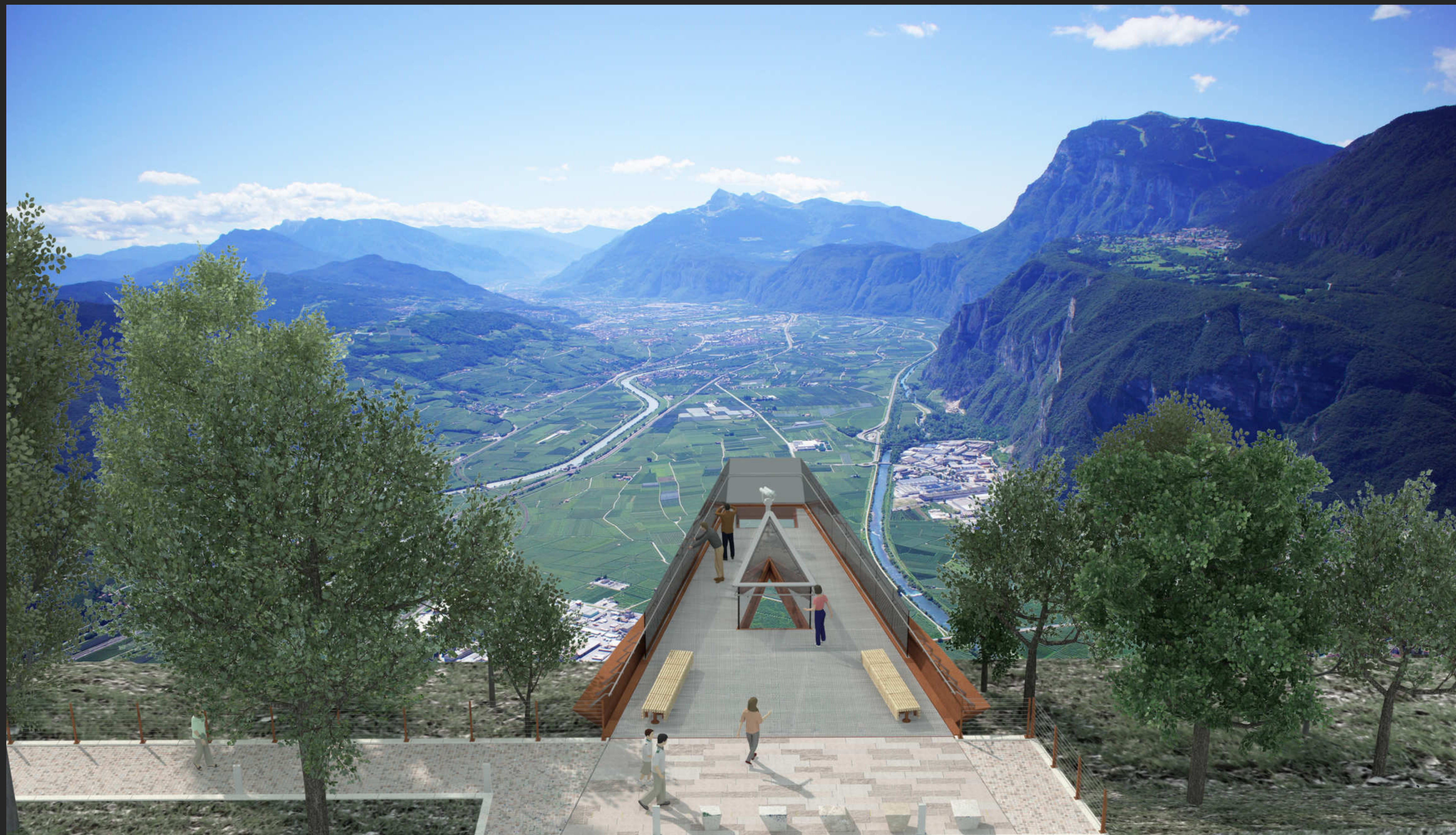
SKYWALK - VISTE RENDERING